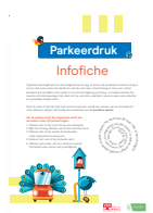
infofiche + beschrijfbare poster