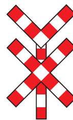
er zijn 2 of meerdere sporen