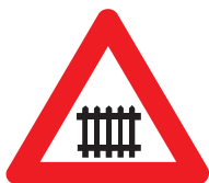
spoorweg met slagbomen