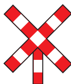
er is 1 spoor