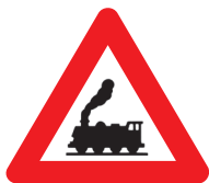
spoorweg zonder slagbomen