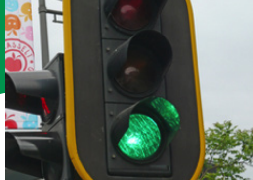
Leg 1 kaart weg