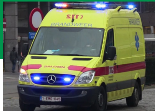
Neem 2 kaarten bij