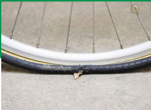
Neem 1 kaart bij