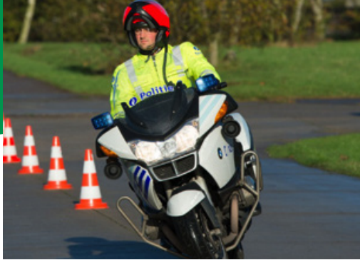
Leg 2 kaarten weg